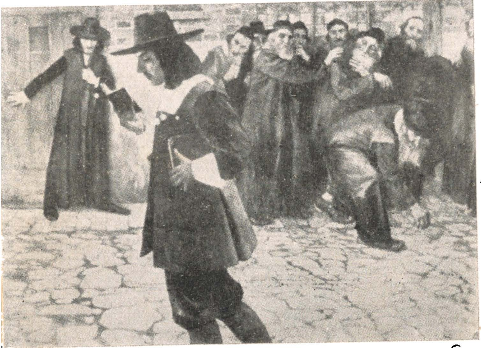
سينوزا في الطريق ، منبوذاً من الناس